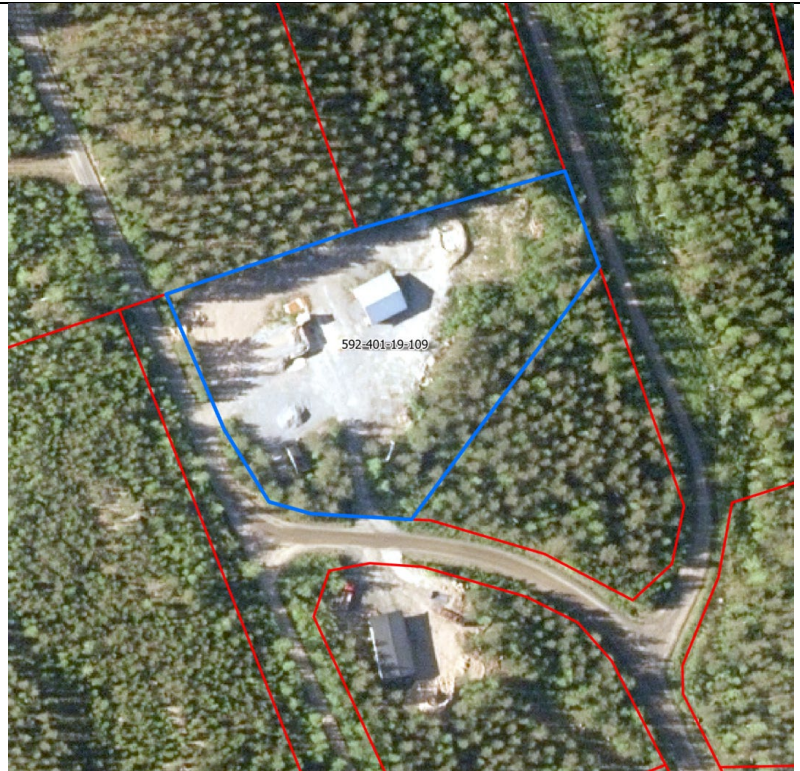
Sisältää Maanmittauslaitoksen Ilmakuva-aineistoa 05/2021. Koordinaatisto: ETRS-TM35FIN