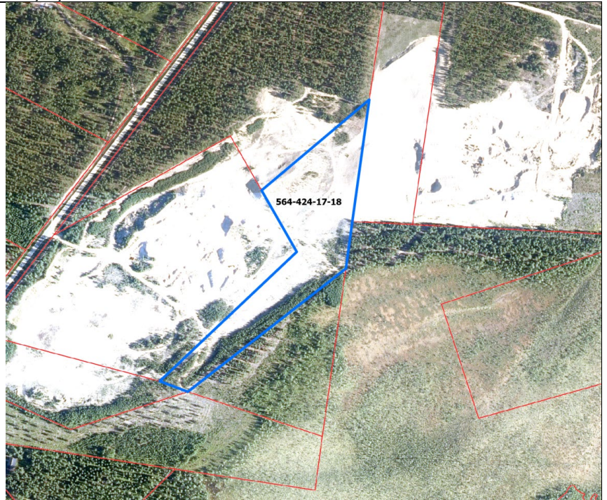
Sisältää Maanmittauslaitoksen Ilmakuva-aineistoa 05/2021. Koordinaatisto: ETRS-TM35FIN