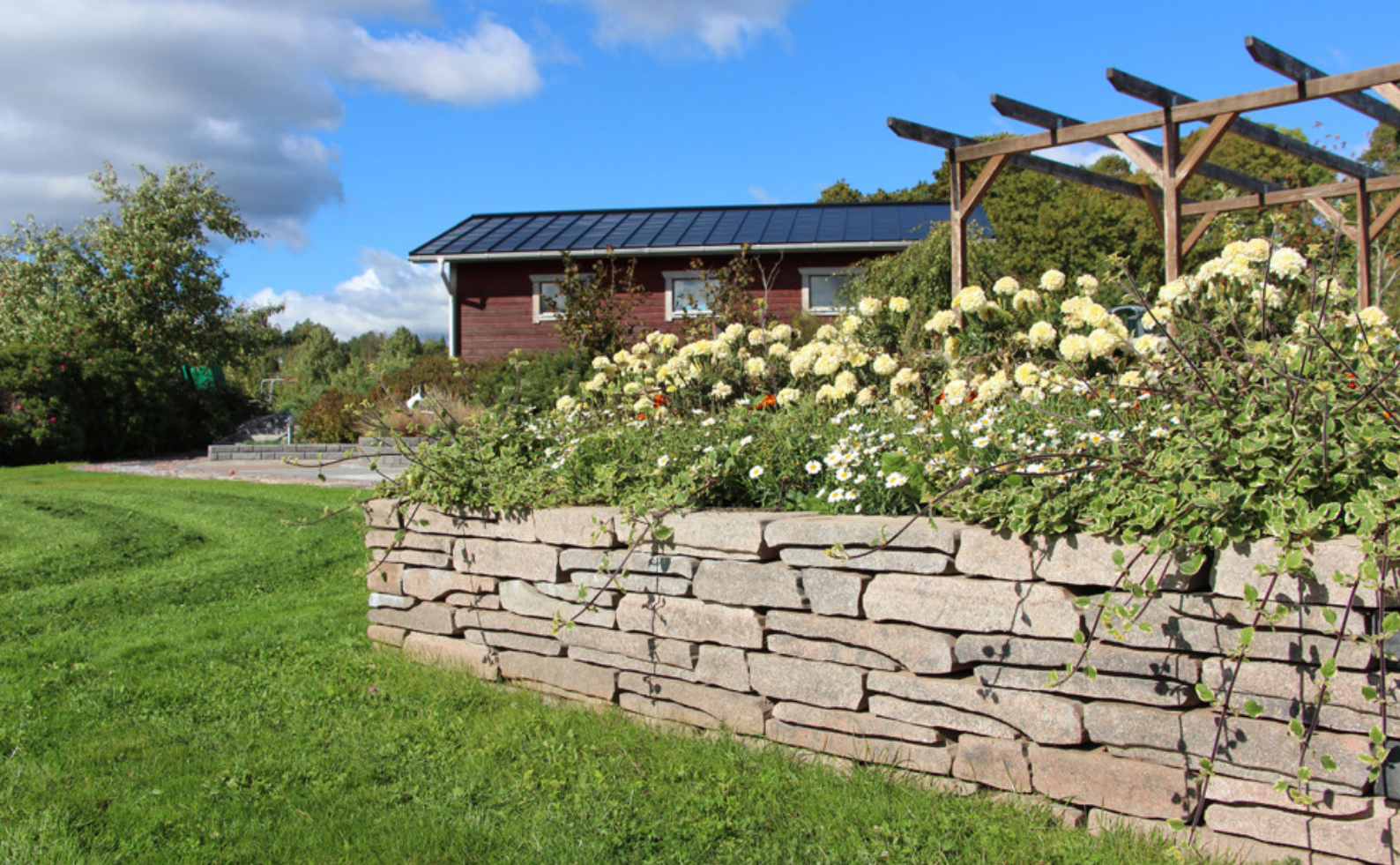
Rustikko-muuri, väri hehku.

Rustikko-muuri on luonnollisen näköinen betonimuurikivi taloyhtiö-, koti- ja mökkipihoille.