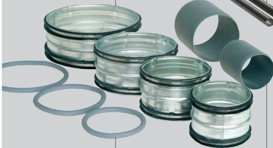
Tätningar av cellgummi